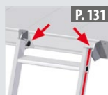
Kit de suspensions