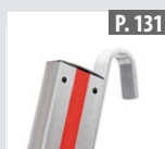
Kit de crochets de suspension